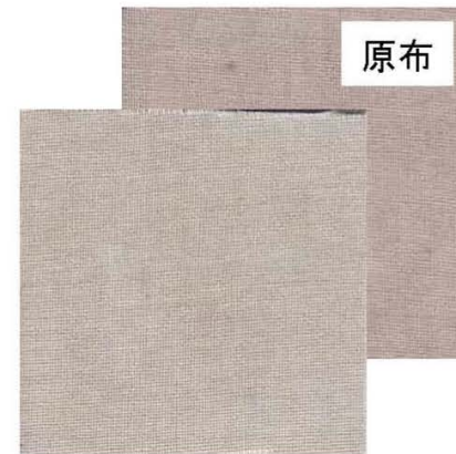
市販洗濯洗剤のみで洗濯した布

部分汚れ解決スプレーで前処理を行うと、洗濯洗剤だけよりも汚れがよく落ち、白度が数段上がっています。厳しい汚染布でのテストでも効果が確認できました。