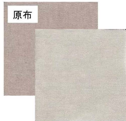
本剤で十分に湿らし15分後に市販洗濯洗剤で洗濯した布